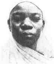
Signature du titulaire